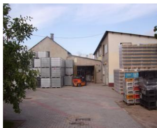
widok ogólny na zakład w Goli Górowskiej