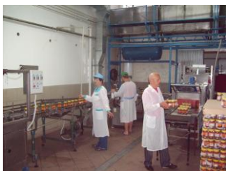
PPHU „Rydełko” linia rozlewania miodu