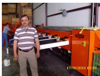
linia sortownicza do jabłek, jeden z elementów wyposażenia przechowalni