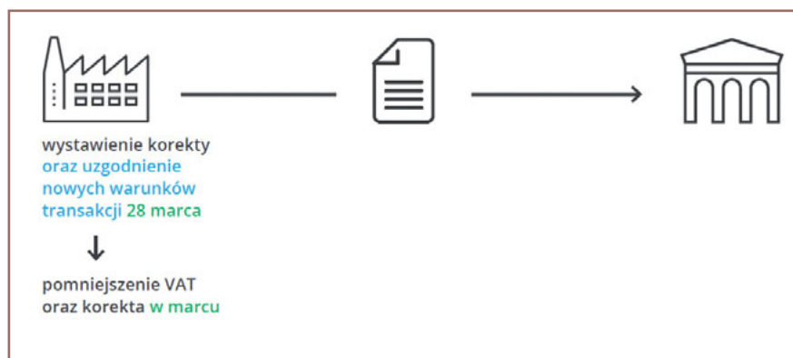
Rys. 4. Korekta „in plus” po zmianie