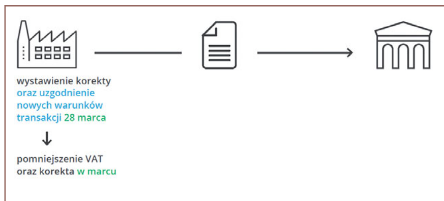
Rys. 2. Korekta „in minus” po zmianie