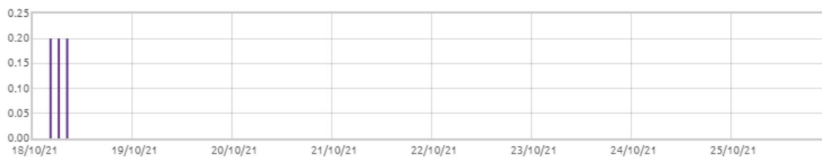
■ Świnobród: Opady deszczu [mm]