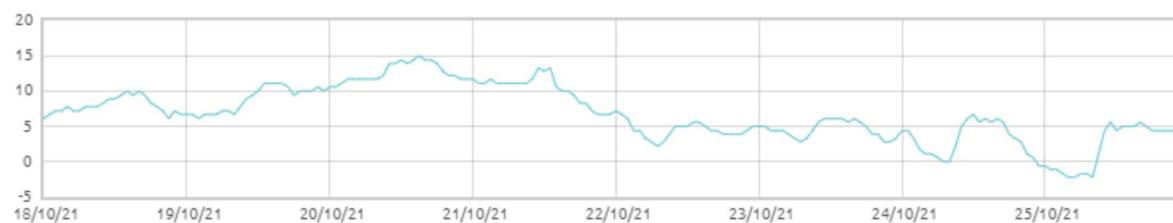
■ Świnobród: Punkt rosy [C]