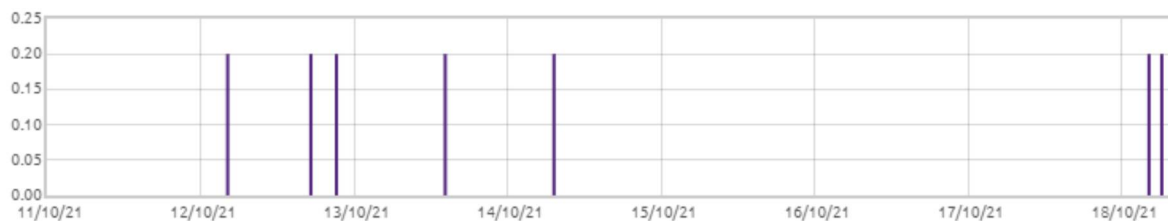
Świnobród: Opady deszczu [mm]