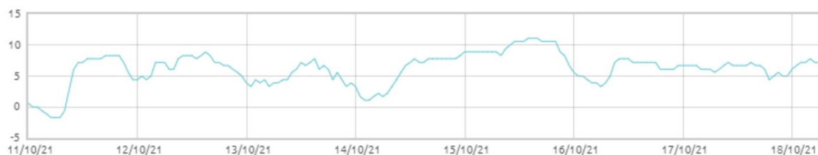
Świnobród: Punkt rosy [C]