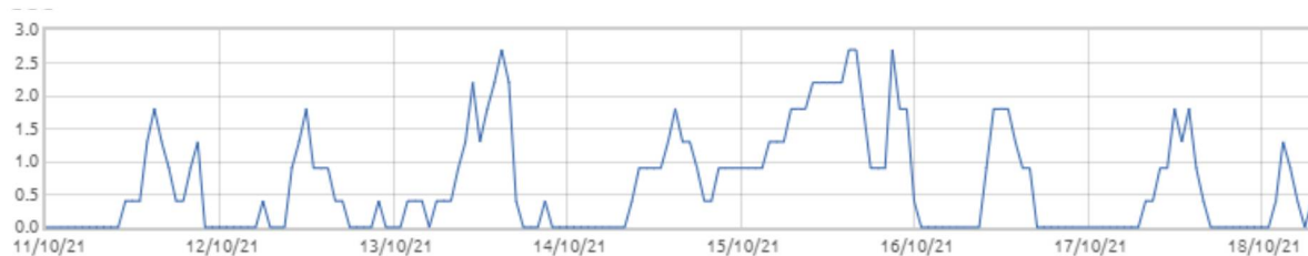
Świnobród: Prędkość wiatru [m/s]