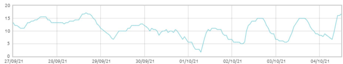
Świnobród: Punkt rosy [C]