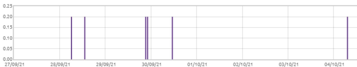
Świnobród: Opady deszczu [mm]