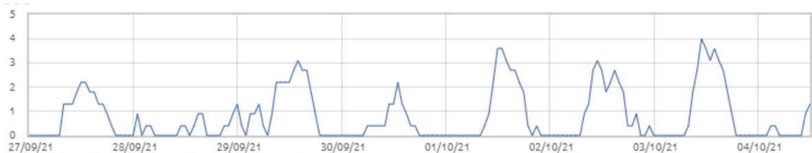
Świnobród: Prędkość wiatru [m/s]