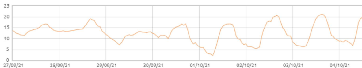
Świnobród: Temperatura powietrza [C]