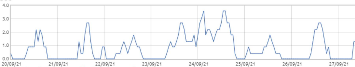
Świnobród: Prędkość wiatru [m/s]