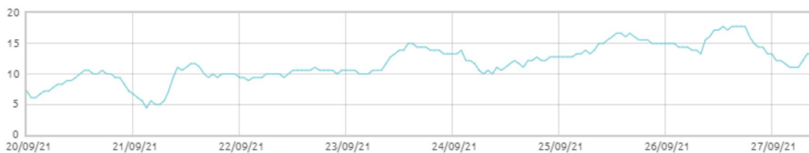
Świnobród: Punkt rosy [C]