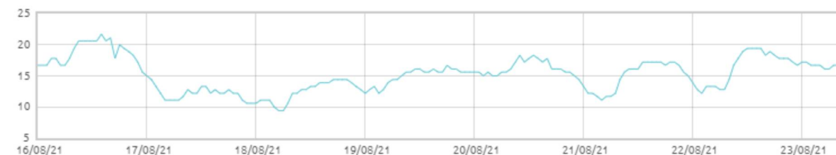
Świnobród: Punkt rosy [C]