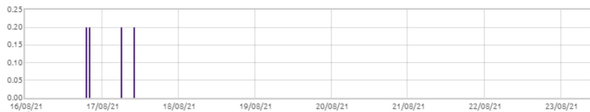
Świnobród: Opady deszczu [mm]