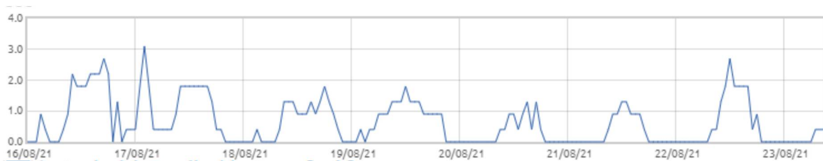
Świnobród: Prędkość wiatru [m/s]