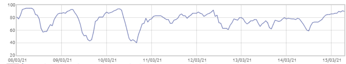
Świnobród: Wilgotność względna powietrza [%]