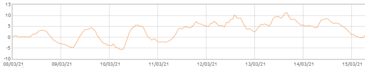
Świnobród: Temperatura powietrza [C]