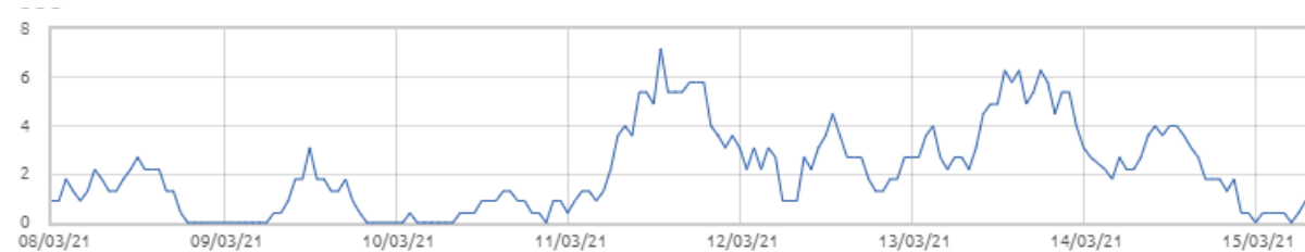
Świnobród: Prędkość wiatru [m/s]