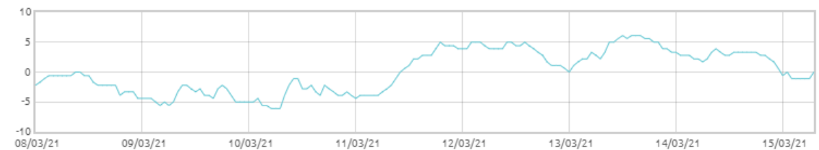
Świnobród: Punkt rosy [C]