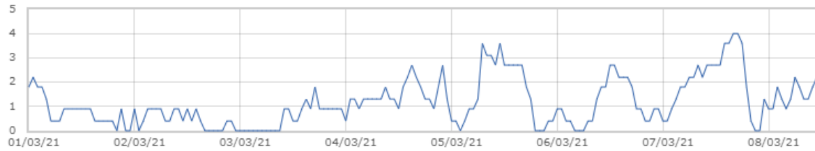
■ Świnobród: Prędkość wiatru [m/s]