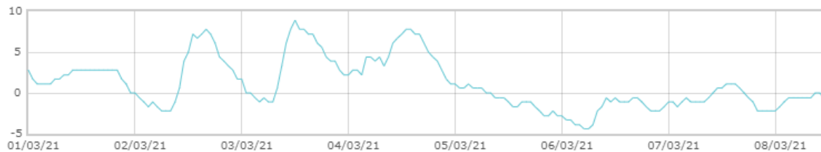
■ Świnobród: Punkt rosy [C]