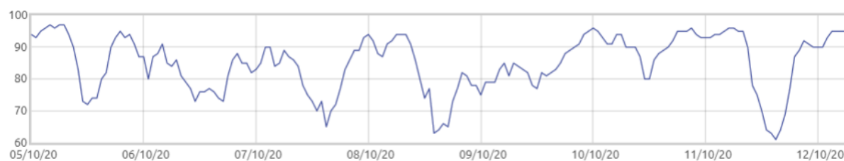
Świnobród: Wilgotność względna powietrza [%]