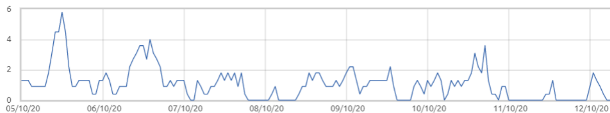
Świnobród: Prędkość wiatru [m/s]