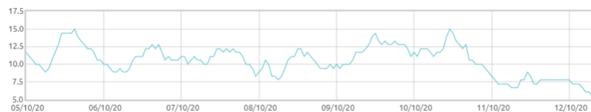
Świnobród: Punkt rosy [C]