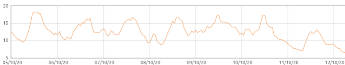
Świnobród: Temperatura powietrza [C]