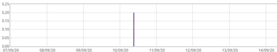
Świnobród: Opady deszczu [mm]