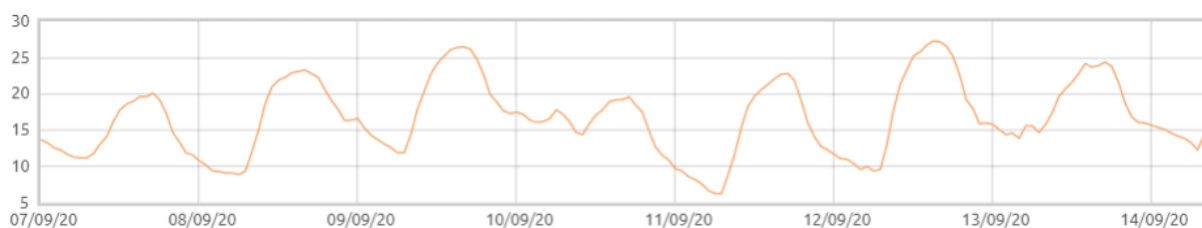
Świnobród: Temperatura powietrza [C]