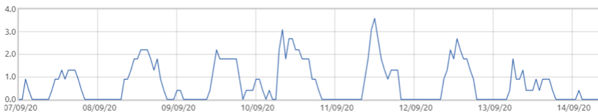
Świnobród: Prędkość wiatru [m/s]