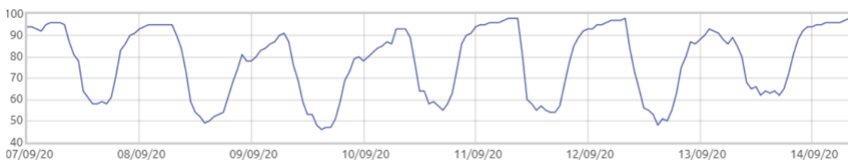
Świnobród: Wilgotność względna powietrza [%]