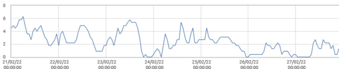
■ Swinobród: Prędkość wiatru [m/s]