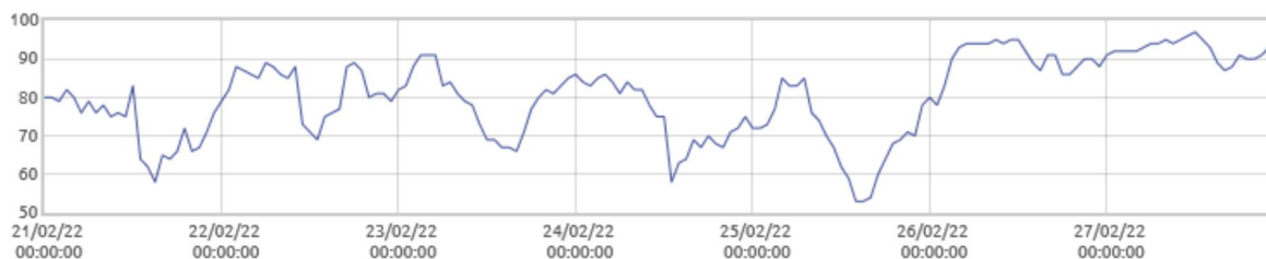
■ Swinobród: Wilgotność względna powietrza [%]