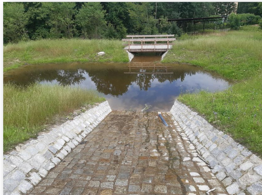
Zbiornik boczny, Leśnictwo Piekiełko, Nadleśnictwo Zdroje