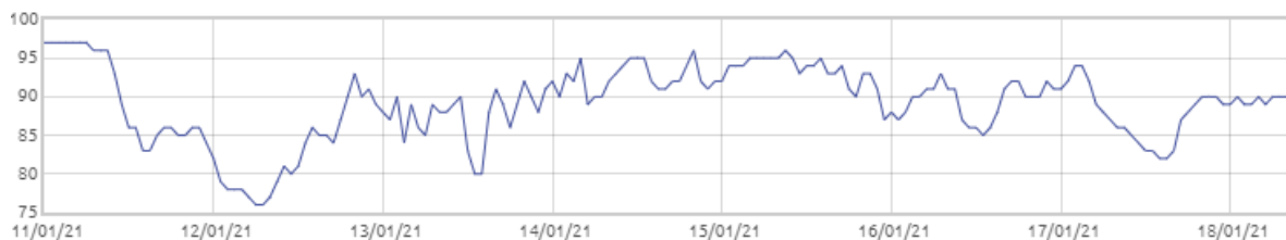
Świnobród: Wilgotność względna powietrza [%]