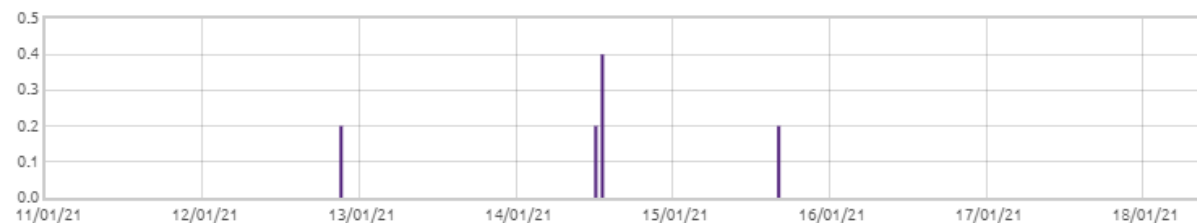
Świnobród: Opady deszczu [mm]