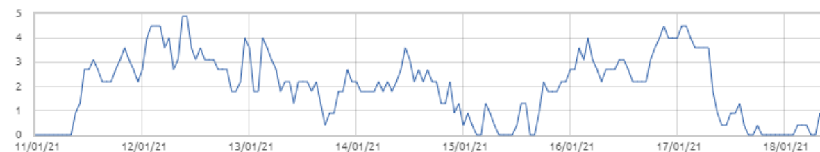
Świnobród: Prędkość wiatru [m/s]